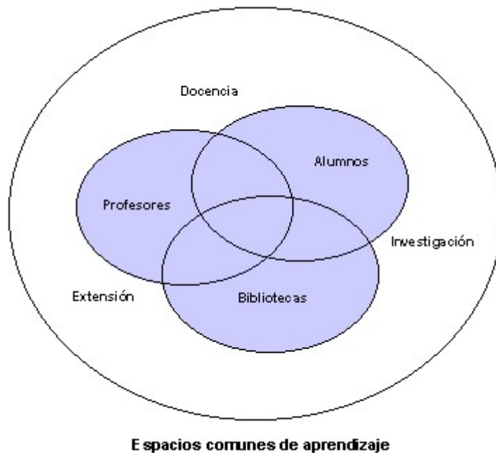
Fig. 1. Espacios comunes de aprendizaje.

La multidisciplinariedad y la horizontalidad retoman espacios. Una economía basada en el conocimiento requiere habilidades de las ciencias sociales y las humanidades, lo que sitúa a estas ciencias en posiciones prioritarias. En Bibliotecología surgen nuevos paradigmas provocados por sus propios cambios internos y por la influencia del entorno.